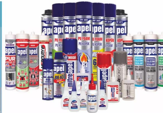
BETA KİMYA ADHESIVOS Y SELLADORES