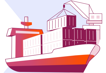
Nihai alıcılar (deniz taşımacılığında)