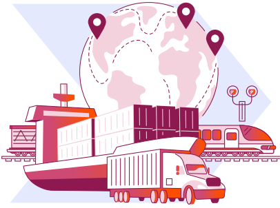
Denizler ve iç sular, kara yolları ve demir yollarında faaliyet gösteren nakliye şirketleri